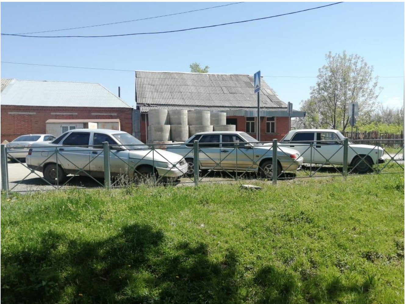
5. Санитарно-гигиенических помещений